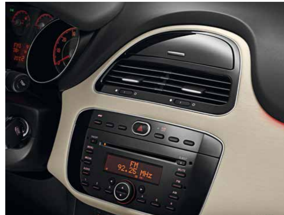
El nuevo Linea es tá repleto de detalles que aumentan el confort de conducción.