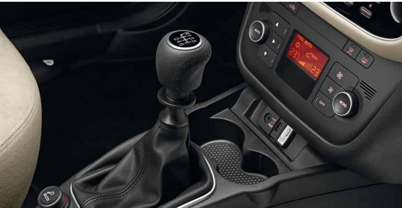
Elegante e impresionante incluso de noche.

Los elevallunas eléctricos delanteros y traseros, y los retrovisores exteriores eléctricos se brindan de serie en el nuevo Linea. El climatizador automático bizona pone a fin a las inevitables discusiones sobre el aire acondicionado en los viajes largos. En resumen, el nuevo Linea brinda la armonía perfecta para tu familia.