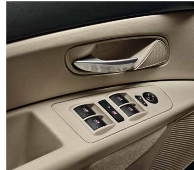
Elevallunas eléctricos delanteros y traseros.